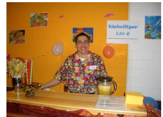
Unterrichtsaktion Saftbar beim Basar